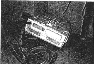
高価な電子天秤も仰向け